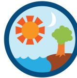
創造の本 羊飼いとしもべ 創造 (青) 缶バッチ