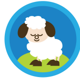
神は羊を導く 羊の缶バッチ