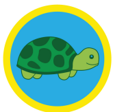
しもべの心 かめの缶バッチ