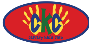
救いの保証パート1 CKCのワッペン