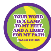
私のための神の計画 詩編119:105の缶バッチ