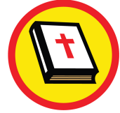
イエス様に愛されている 聖書の缶バッチ