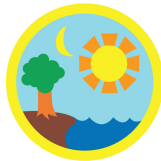
創造の本 羊 想像 (黄色) 缶バッチ