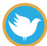
愛の章 鳩の缶バッチ