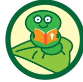
神の腕の中で守られている みみずの缶バッチ