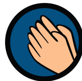
主の祈り お祈りの缶バッチ