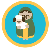
羊飼いの愛 羊飼いと羊 (金) 缶バッチ