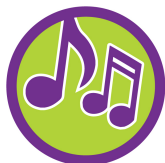
礼拝と賛美 音符の缶バッチ