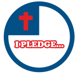
スターターブック 「誓い」の缶バッチ